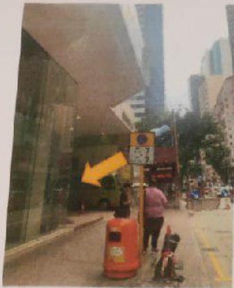
1) 從華美粵海酒店旁邊停車位行人