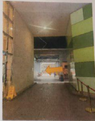
2) 行幾步再轉入左手邊後巷