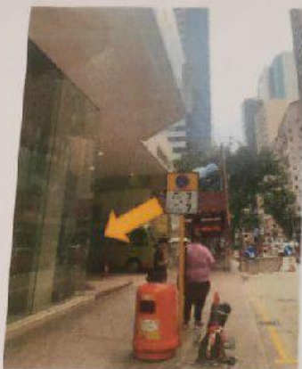
1) 從華美粵海酒店旁邊停車位行人